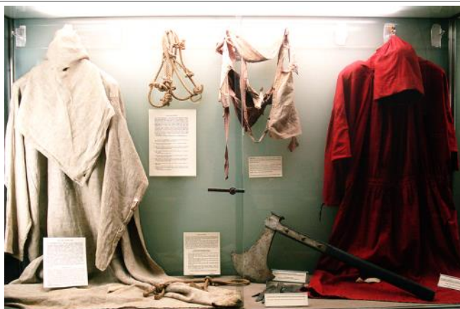
Μανδύες και αυθεντικά εργαλεία του Δημιου της Ρώμης Mastro Titta.