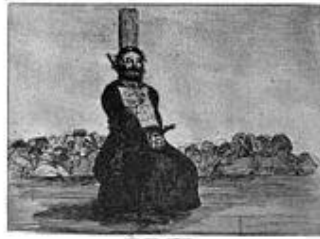
A Spanish priest garroted by Napoleon's forces for carrying a pocket knife