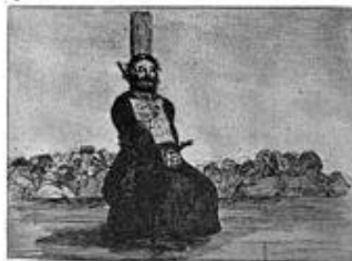
A Spanish priest garrotted by Napoleon's forces for carrying a pocket knife