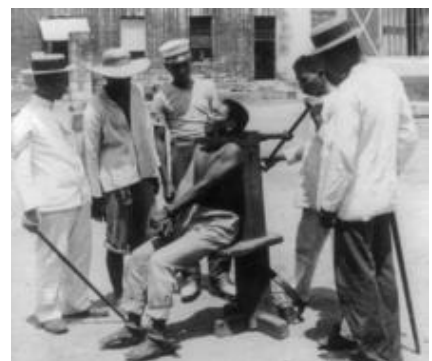
A 1901 execution at the old Bilibid Prison, Manila, Philippines