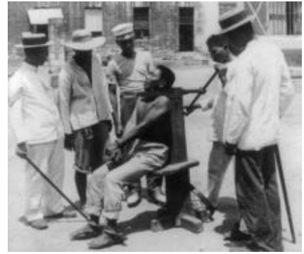
A 1901 execution at the old Bilibid Prison, Manila, Philippines