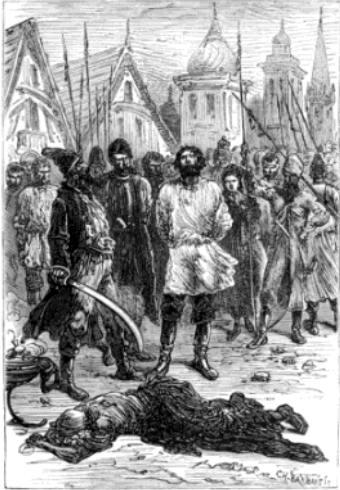
Michel Stragoff's work. (Page 206.)

Ο ταχυδρόμος του Τσάρου Μιχαήλ Στρογκώφ τυφλώνεται από τον ηγέτη των Τατάρων Ιβάν Ογκαρέφ δια πύρος και σιδήρου . Του κρατούν μπροστά στα μάτια ένα πυρωμένο ξίφος που εξατμίζει κάθε υγρό του ματιού και προκαλεί τύφλωση. Ευτυχώς που το παλληκάρι είχε βάλει τα κλάματα και έτσι έσωσε τα μάτια του ... κι έζησαν αυτοί καλά κι εμείς καλύτερα.