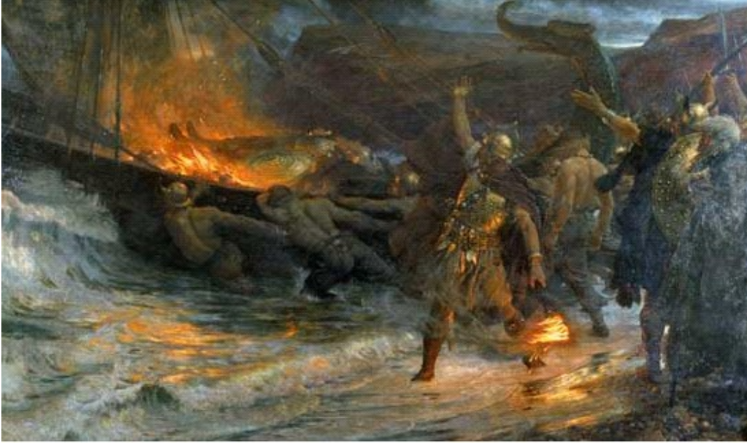
Funeral of a Viking, Sir Frank Dicksee