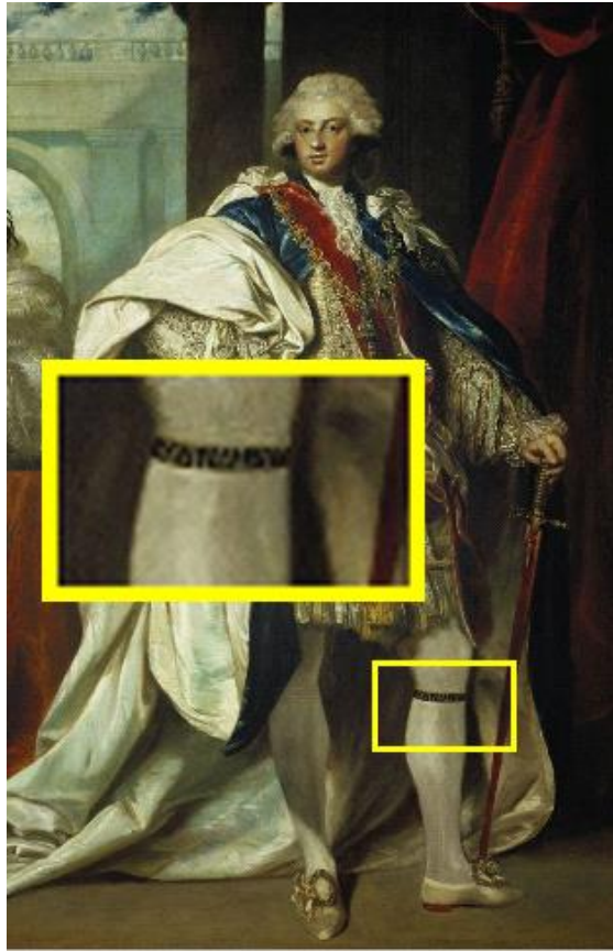
Έτερος Ευγενής με καλτσοδέτα