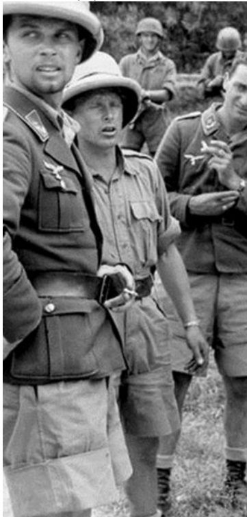
Κασκα των γερμανων κατακτητων στη μαχη της Κρήτης