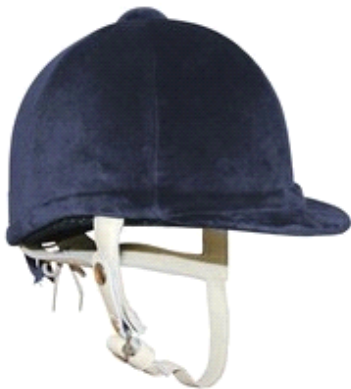
Κασκετο τζοκευ, δηλ. αναβάτη αλόγου σε ιππόδρομο, σύγχρονο