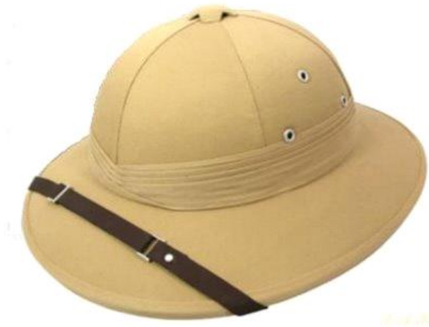
Κάσκα λευκου αποικιοκράτη της Αφρικής