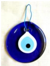
ΕΙΚΟΝΑ 6 - Ο ΠΑΝΤΕΠΟΠΤΗΣ ΟΦΘΑΛΜΟΣ