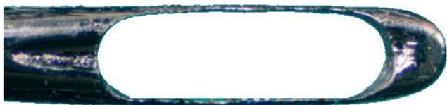
ΕΙΚΟΝΑ 9 - Με τα χεράκια μας βγάλαμε τα ματάκια μας