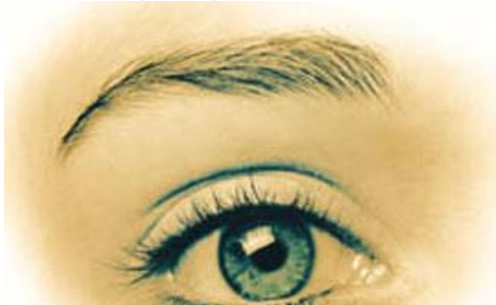
ΕΙΚΟΝΑ 1 - Ανθρώπινο ματι