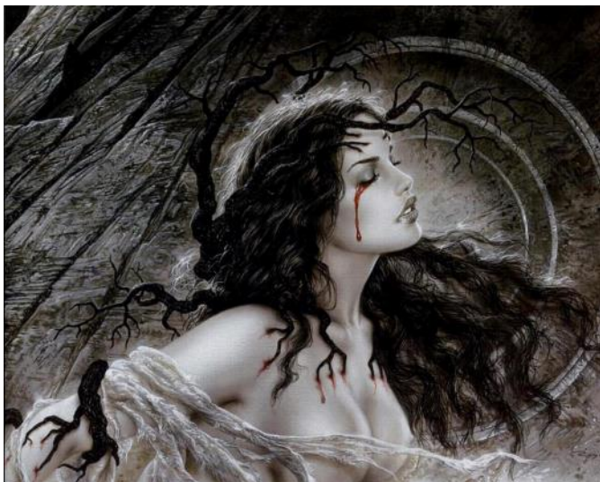
ΕΙΚΟΝΑ 10 - Clin d'oeil - Κλείσιμο του ματιού