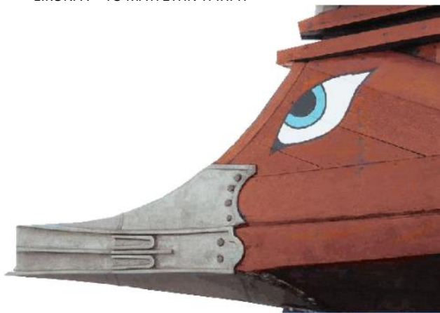
ΕΙΚΟΝΑ 8 - ΤΟ ΜΑΤΙ ΤΗΣ ΒΕΛΟΝΑΣ