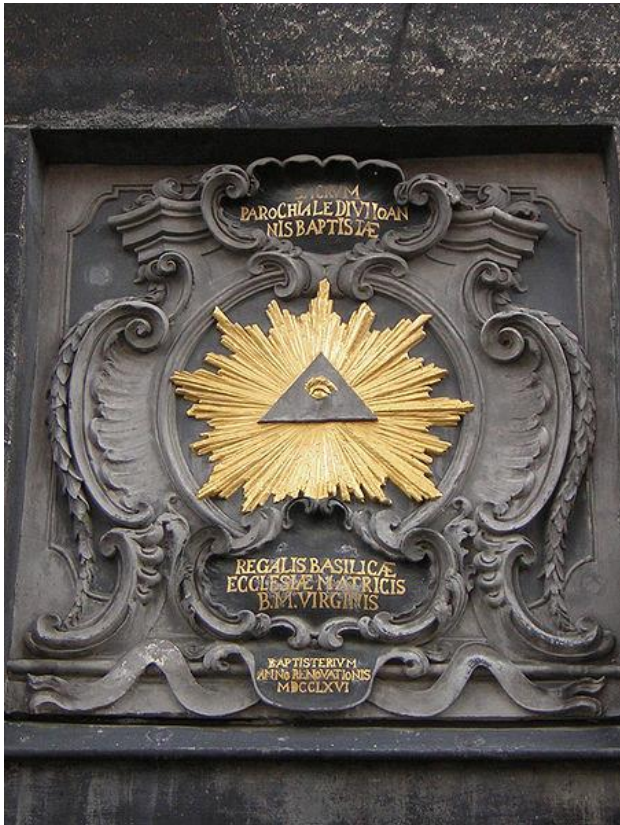
ΕΙΚΟΝΑ 7 - ΤΟ ΜΑΤΙ ΣΤΗΝ ΤΡΙΗΡΗ