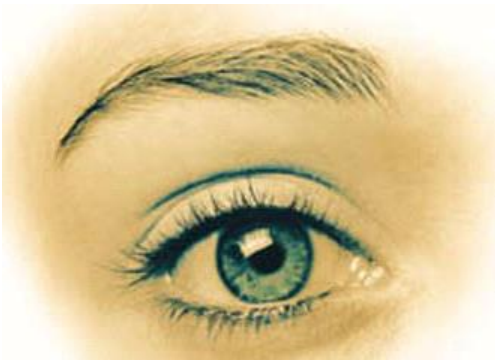
ΕΙΚΟΝΑ 2 - ΜΑΤΙ ΠΟΡΤΑΣ ΗΛΕΚΤΡΟΝΙΚΟ