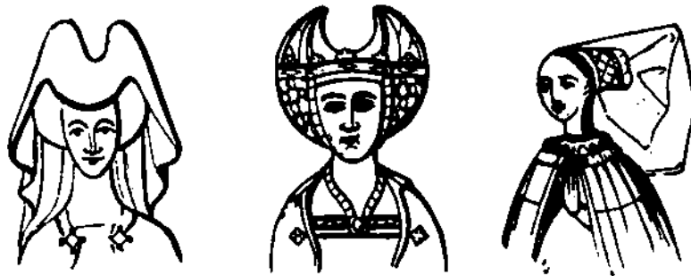
Mitred, horned, and wired head-dresses of the fifteenth century.