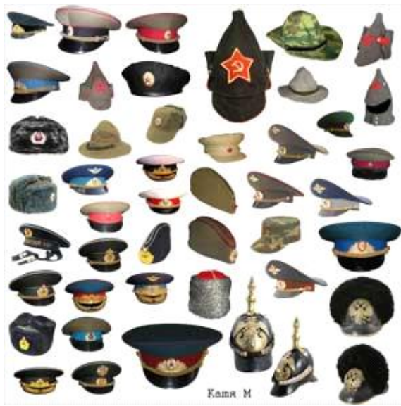
Πιλοποιεΐον Ν. Πουλοπουλου