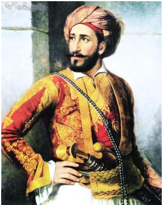
Man in a Red Turban, 1433 - Jan van Eyck