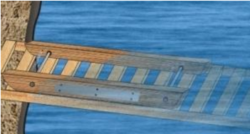
ΤΟ ΒΑΣΑΝΙΣΤΗΡΙΟ ΤΗΣ ΦΑΛΑΓΓΑΣ Η ΑΡΧΑΙΑ ΠΟΔΟΚΑΧΗ