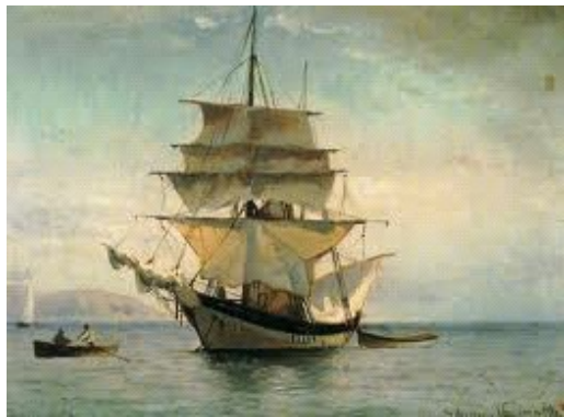
Το λιμάνι της Κοπεγχάγης Καΐκι - Ιωάννης Αλταμούρας