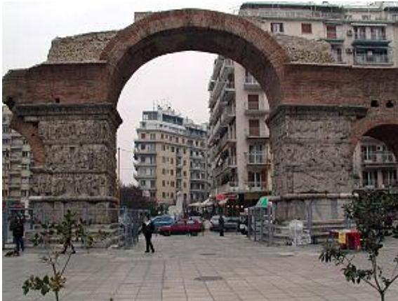
Η αψίδα του Γαλεριου, ( καμάρα ) στη Θεσσαλονίκη