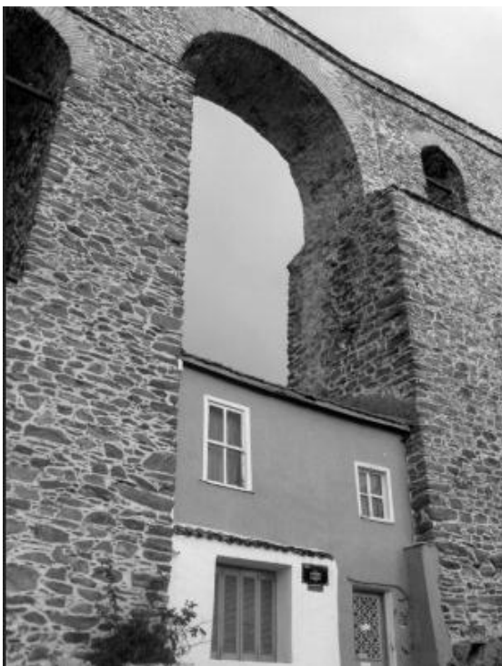
Το Υδραγωγείο της Καβάλας (κν καμάρα)

Εδώ ο πονηρός ρωμιός εξοικονομεί δυο τοίχους, προστατεύει τα κεραμίδια του, η Πολεοδομία καθεύδει υπό τον Μανδραγόρα και η εφορία αρχαιοτήτων αντιμετωπίζει το θέμα με φακρική απάθεια.