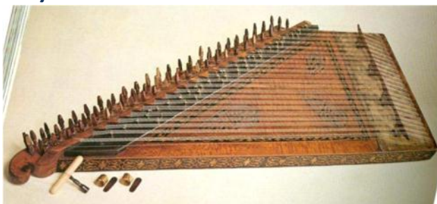
1. κανονακι ή ψαλτήριο