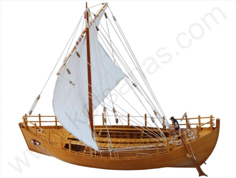
Η Ολκάς "ΚΥΡΗΝΕΙΑ" ΠΗΓΗ 2