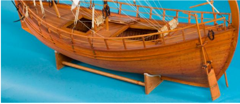
Σκαρί ολκάδος