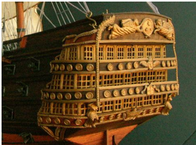
LA VILLE DE PARIS Cet imposant vaisseau participa activement à la guerre d'indépendance Américaine sous les ordres des amiraux Guichen et De Grasse.

ἐξεμπολημένων σφι σχεδόν πάντων, ἐλθεῖν ἐπὶ τὴν θάλασσαν γυναῖκας ἄλλας τε πολλὰς καὶ δὴ καὶ τοῦ βασιλέως θυγατέρα· τὸ δὲ οἱ οὔνομα εἶναι, κατὰ τώυτὸ τὸ καὶ Ἕλληνές λέγουσι, Ἰοῦν τὴν Ἰνάχου· 4 ταύτας στάσας κατὰ πρύμνην τῆς νεὸς ὠνέεσθαι τῶν φορτίων τῶν σφι ἦν θυμὸς μάλιστα· καὶ τοὺς Φοίνικας διακελευσαμένους ὀρμησαὶ ἐπ' αὐτάς· τὰς μὲν δὴ πλεῦνας τῶν γυναικῶν ἀποφυγεῖν, τὴν δὲ γοῦν σὺν ἄλλῃσι ἀρπασθῆναι. ἐσβαλομένους δὲ ἐς τὴν νέα οἴχεσθαι ἀποπλέοντας ἐπ' Αἰγύπτου.