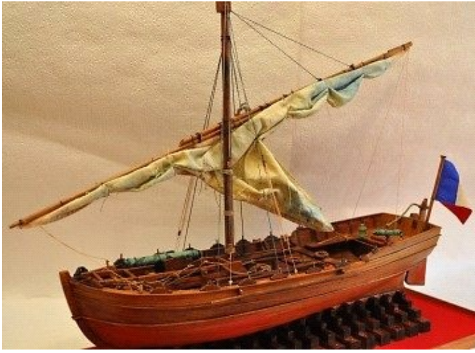
Σχέδια για εξοπλισμένο σλέπι