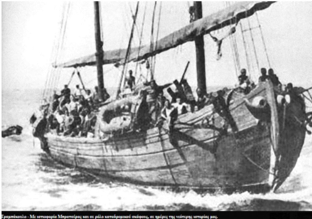
Τραμπάκουλο - Με ιστοροφία Μπρατούρας και οι ρόλο καταδρομικού σκάφους, οι ημέρες της νέστερης ιστορίας μας.