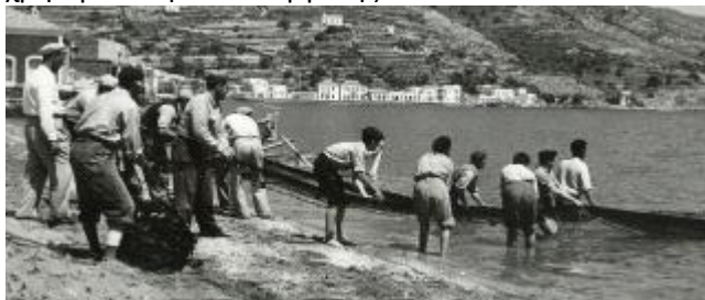
Τραβηγμα της τρατας με τα χερια από τη στερια. Φωτο 1962

Το δίχτυ αυτό έλκεται από κωπήλατο ή /και ιστιοφόρο (ανεμότρατα) ή μηχανοκίνητο (μηχανότρατα) πλεύμενο που καλείται κατά συνεκδοχή επίσης τράτα . Μετά το δίχτυ: ή σύρεται με τα χέρια στη στεριά ή ανεβάζεται πάνω στην τράτα. Και στις δύο περατώσεις είναι δυνατό να χρησιμοποιηθεί και εργάτης.