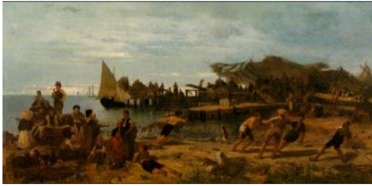
Τρατα -Έργο σε μουσαμά του Κωνσταντίνου Βολανάκη.

Χρησιμοποιείται στην αλιεία στην Μεσόγειο.