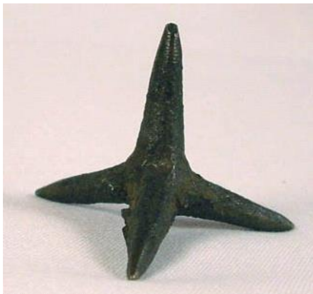
ΕΙΚΟΝΑ 1 ΤΡΙΒΟΛΟΣ