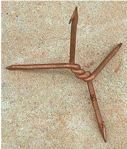
ΕΙΚΟΝΑ 3 - ΤΡΙΒΟΛΟΣ ΤΟΥ ΠΟΛΕΜΟΥ ΤΟΥ ΒΙΕΤΝΑΜ