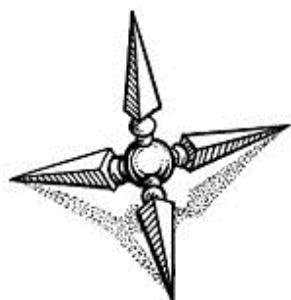
🕒 ΕΙΚΟΝΑ 2 ΤΡΙΒΟΛΟΣ- ΤΥΠΟΣ SUDIS