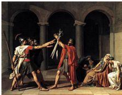
Ο Ορκος των Ορατιων του Jacques-Louis David