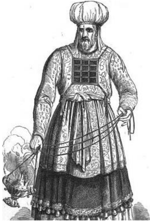
ΕΒΡΑΙΟΣ Αρχιερέας με την μεγάλη στολή. (ΜΕ ΣΧΗΜΑ;)