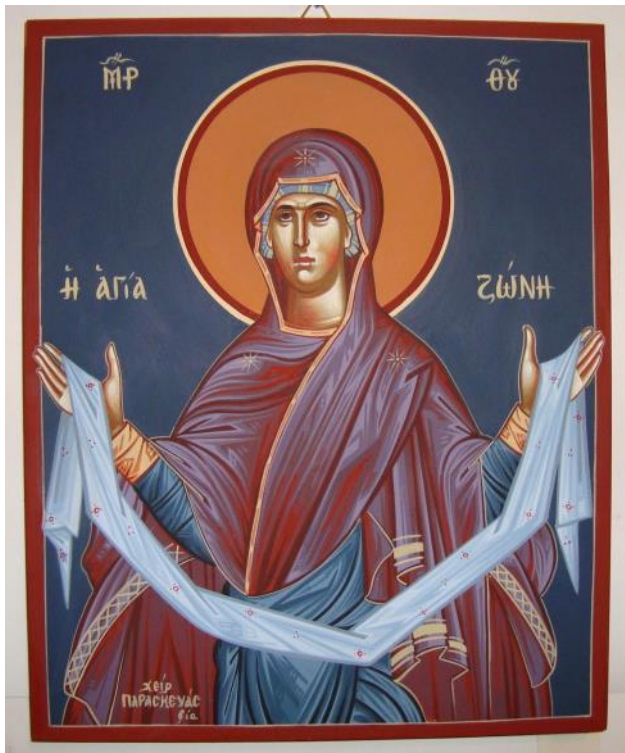
Η αγία ζώνη