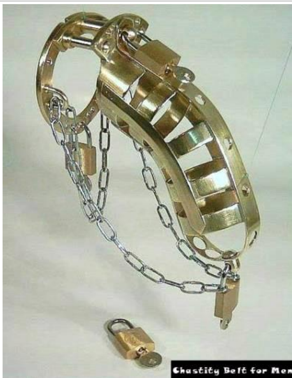
Συγχρονος ανδρική. (Μετα την εξίσωση των φύλων).