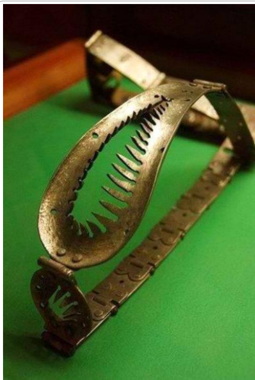
Ζωνη αγνότητος διπλης εισοδου - Οι παραβάτες τιμωρούνται.