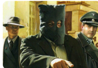
ΚΑΡΦΙ - ΚΑΤΑΔΟΤΗΣ