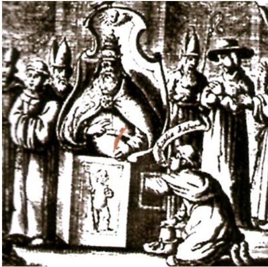
Οι Τρύπιοι Θρόνοι