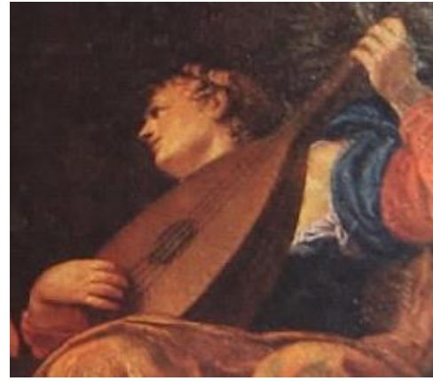
ΤΟΙΧΟΓΡΑΦΙΑ ΓΙΑ ΤΗΝ ΠΑΛΙΑ ΒΙΒΛΙΟΘΗΚΗ ΤΟΥ ΑΓΙΟΥ ΜΑΡΚΟΥ: "Η ΜΟΥΣΙΚΗ" ΕΡΓΟ ΤΟΥ ΒΕΡΟΝΕΖΕ - ΤΩΡΑ ΣΤΗ ΜΑΡΚΙΑΝΗ ΒΙΒΛΙΟΘΗΚΗ ΣΤΗ ΒΕΝΕΤΙΑ.