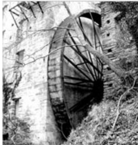
Εικόνα 9 ΜΥΛΟΙ ΓΙΑ ΚΑΦΕ Η ΠΙΠΕΡΙ