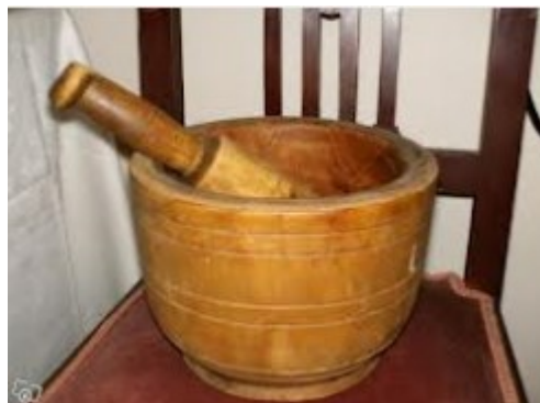
Εικόνα 4 ΞΥΛΙΝΟ ΓΟΥΔΙ ΣΚΟΡΔΑΛΙΑΣ