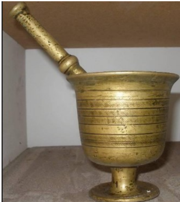
Εικόνα 3 ΜΠΡΟΥΤΖΙΝΟ ΓΟΥΔΙ ΤΟΥ 1904