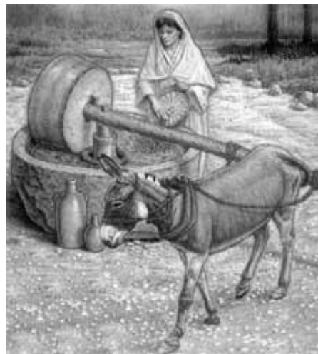
Εικόνα 6 ΟΝΟΜΥΛΟΣ