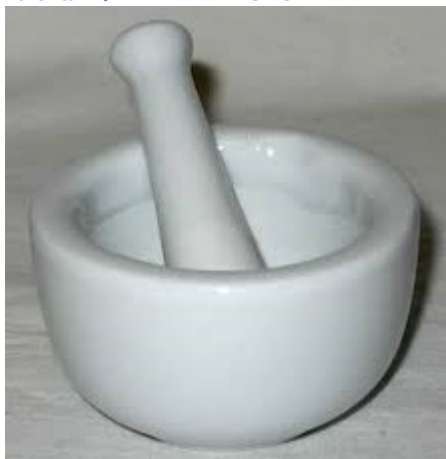
Εικόνα 1 ΦΑΡΜΑΚΕΥΤΙΚΟ ΓΟΥΔΙ