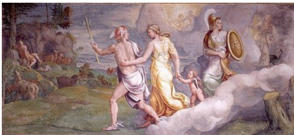
Εικόνα 1 Η ΚΡΙΣΙΣ ΤΟΥ ΠΑΡΙΔΟΣ

The Judgement of Paris Giulio Romano 1499 - 1546 Sala di Troia Ducal Palace Mantua