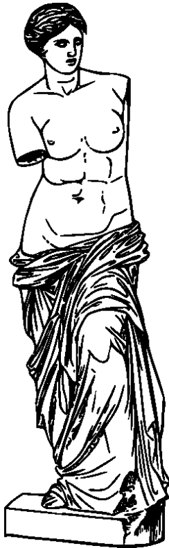
Εικόνα 2 -Η ΑΦΡΟΔΙΤΗ ΤΗΣ ΜΗΛΟΥ

Η Αφροδίτη της Μήλου είναι ένα πολύ γνωστό μαρμάρινο άγαλμα, της ελληνιστικής εποχής, το οποίο βρέθηκε την άνοιξη του 1820 σε αγροτική περιοχή της Μήλου, σε θέση αρχαίου οικισμού, από έναν αγρότη που λεγόταν κατά πάσα πιθανότητα Θεόδωρος ή Γεώργιος Κεντρωτάς. Ο ίδιος, λόγω των πολλών πιέσεων που δέχτηκε (από Γάλλους αρχαιολόγους και διπλωμάτες, από τους Έλληνες προκρίτους του νησιού και από τον δραγουμάνο Μουρούζη που εκπροσωπούσε και την Υψηλή Πύλη, δηλαδή την κυβέρνηση των Οθωμανών) μάλλον δεν μπόρεσε να κερδίσει κάτι σημαντικό από το εύρημά του, αν και οι περισσότερες πηγές αναφέρουν ότι πήρε 400 γρόσια. Το άγαλμα, που βρέθηκε σε πάνω από 6 χωριστά κομμάτια, κατέληξε ένα χρόνο αργότερα στο Μουσείο του Λούβρου, όπου και εκτίθεται μέχρι σήμερα. Στο μουσείο της Μήλου υπάρχει ένα πιστό αντίγραφο του, το οποίο έστειλε αργότερα ως δωρεά το Λούβρο.