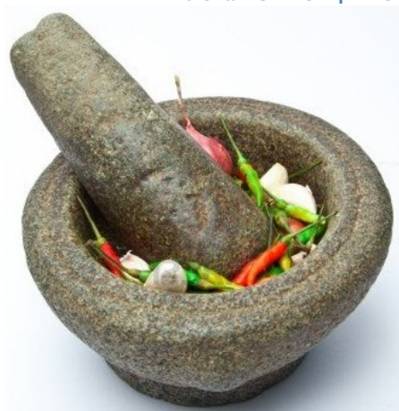
Εικόνα 2 ΟΛΜΟΣ ή ΙΓΔΙΟΝ