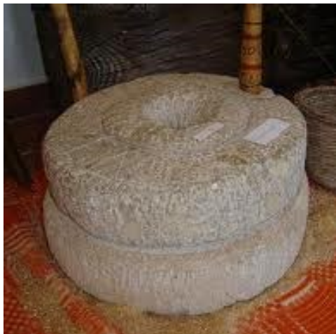
Εικόνα 5 ΧΕΙΡΟΜΥΛΟΣ