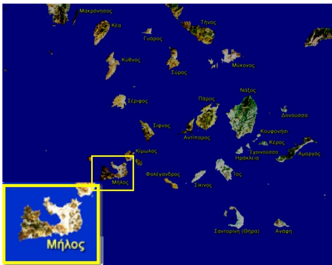
Εικόνα 1 Η ΜΗΛΟΣ ΜΙΑ ΤΩΝ ΚΥΚΛΑΔΩΝ