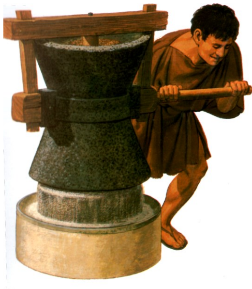
Εικόνα 2Α ΔΟΥΛΟΚΙΝΗΤΟΣ ΜΥΛΟΣ ΕΛΑΙΟΤΡΙΒΕΙΟΥ