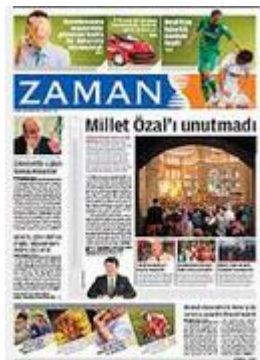
Εικόνα 1 Zaman : οι Times της Τουρκίας