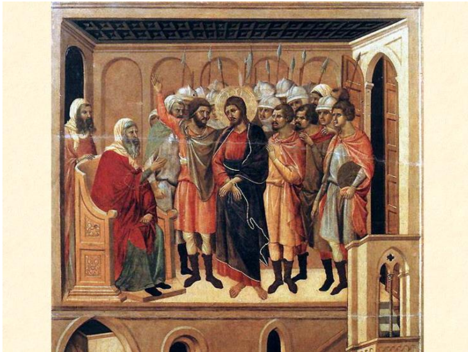
Ο ΙΗΣΟΥΣ ΜΕ ΤΑ ΠΕΘΕΡΙΚΑ (ΤΟΝ ANNA)