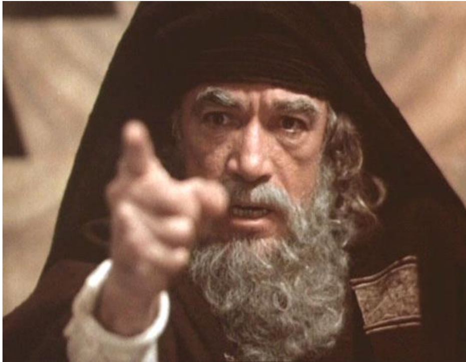
Ο Αντону Κουην ως Καιαφας στο εργο ο Ιησους από την Ναζαρετ