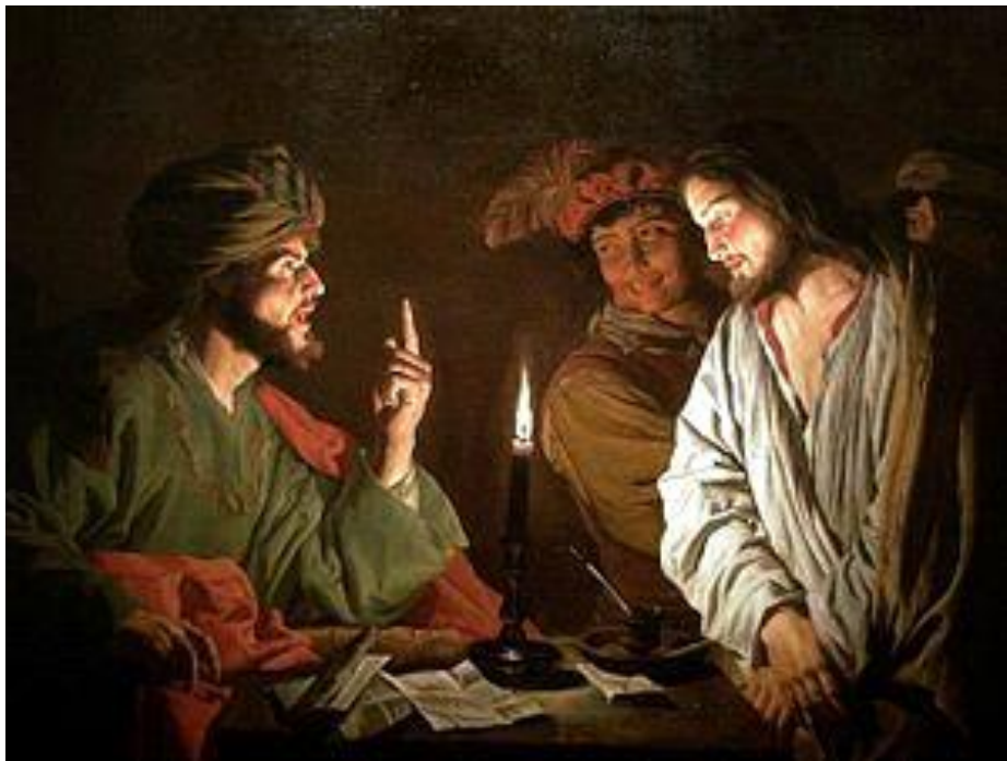
Ο ΙΗΣΟΥΣ ΠΡΟ ΤΟΥ ΚΑΙΑΦΑ ΤΟΥ Matthias Stom.