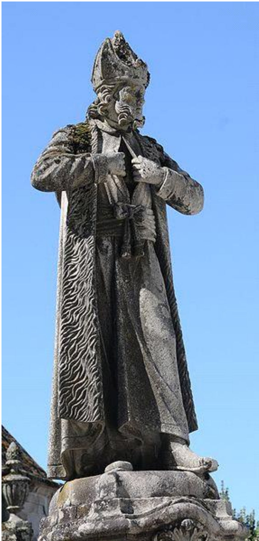
Ο ΚΑΙΑΦΑΣ ΑΓΑΛΜΑ ΣΤΟ Bom Jesus, Braga, Portugal ενώ διαρρηγνύει τα ματιά του 3