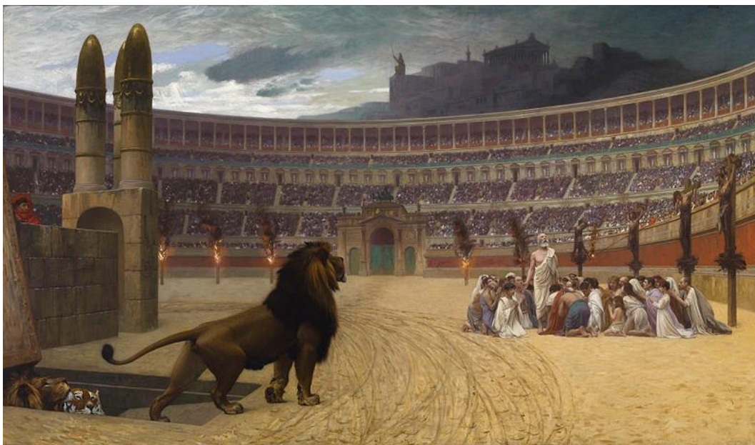
Εικ. 4 Amphitheatrum Flavium - Colosseo - Rome