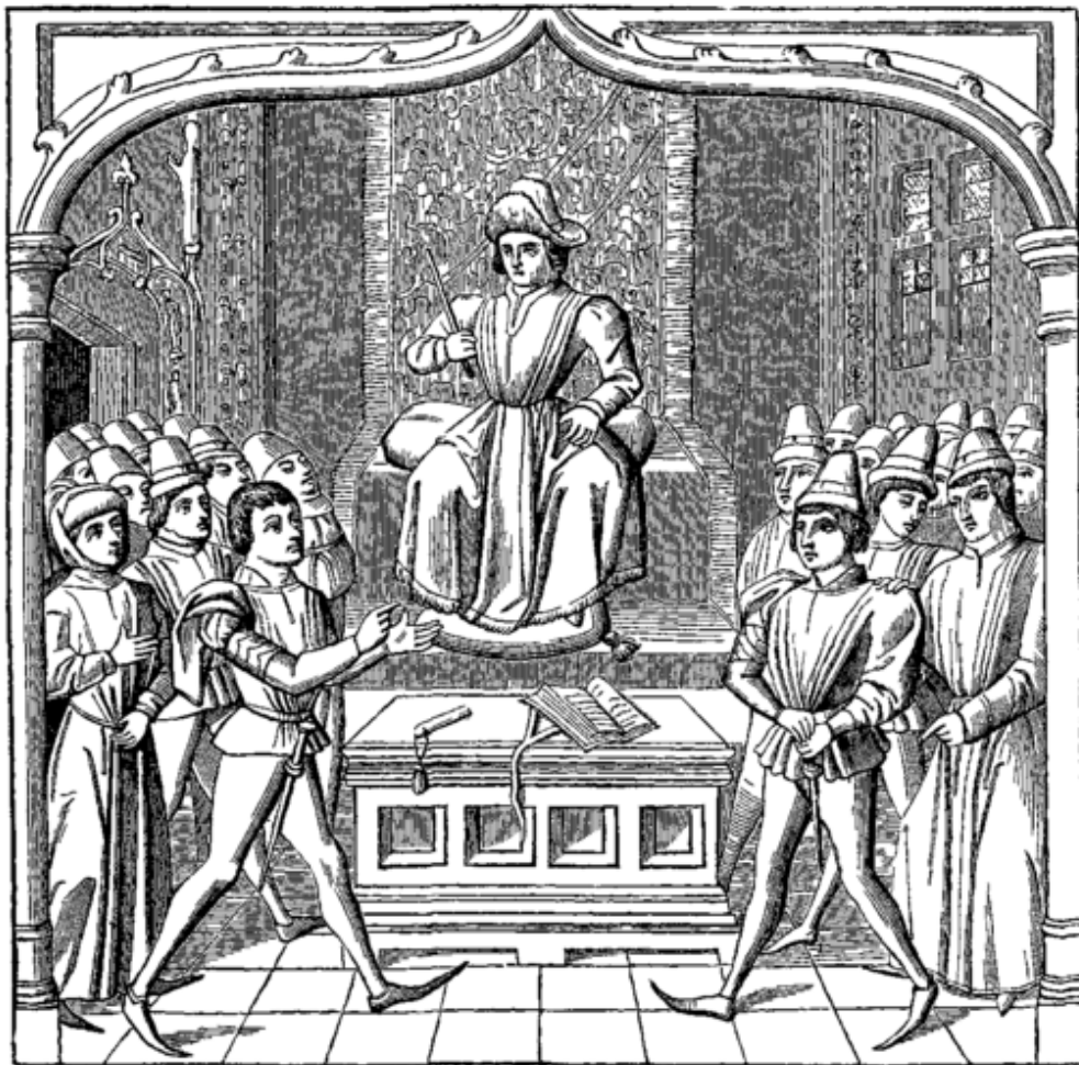
Fig. 300.—The Judicial Duel. The Plaintiff opening his Case before the Judge.—Fac-simile of a Miniature in the “Cérémonies des Gages des Batailles,” Manuscript of the Fifteenth Century in the National Library of Paris.

Pasted from < http://en.wikipedia.org/wiki/Trial_by_combat >