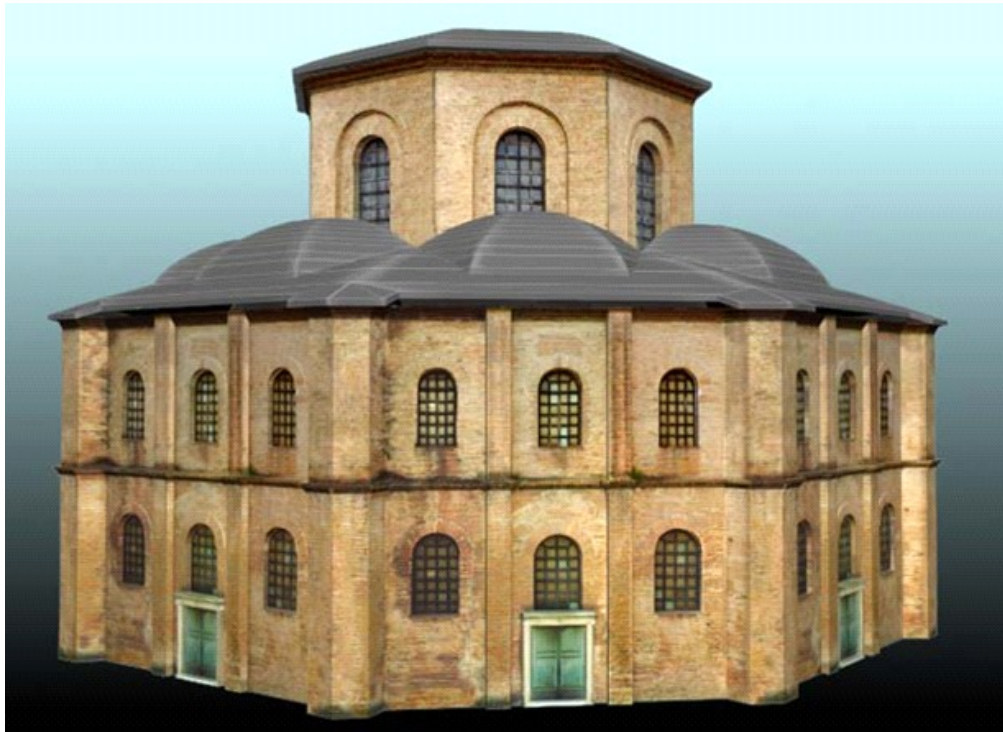
Ο ΧΡΥΣΙΤΡΙΚΛΙΝΟΣ - Η ΑΙΘΟΥΣΑ ΤΟΥ ΘΡΟΝΟΥ