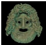
ΘΕΑΤΡΟΥ - ΤΡΑΓΙΚΗ