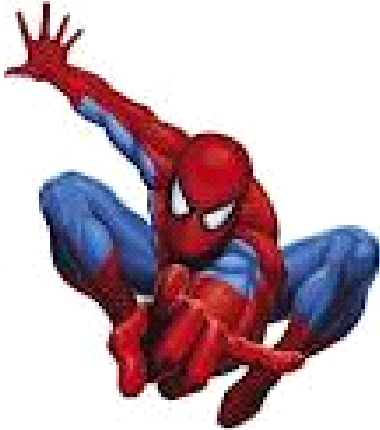
ο άνθρωπος αράχνη ή spiderman