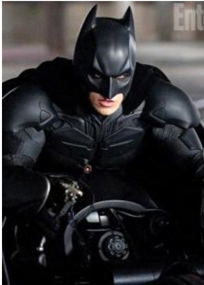
ο μπατ μαν ο ανθρωπος νυχτεριδα