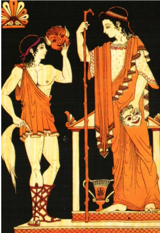
Μικρό δείγμα μασκών παρακάτω.