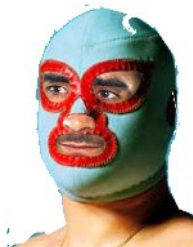
ΚΑΠΩΣ ΕΤΣΙ ΗΤΑΝ Ο ΜΑΣΚΟΦΟΡΟΣ

Ψευδώνυμο παλαιστή ελευθέρας παλης (κατς) της δεκαετίας του 1960. Ο Μασκοφόρος ήταν ο αιώνιος αντίπαλος και "εχθρός" του Ανδρέα Λαμπράκη.