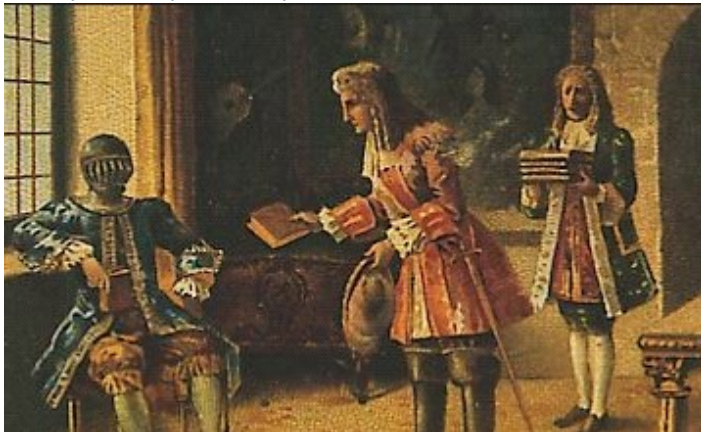
Ο άνθρωπος με το σιδηρούν προσωπίον Ποίηση

. Οι στίχοι του «Γκρέκο Μασκαρά » από τον Γιάννη Μηλιώκα: