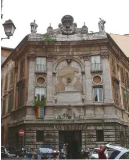
Το κτήριο της Εδρας

Σήμερα ονομάστηκε Banco di Roma για να μην κατηγορηθεί για τοκογλυφία το Αγιο Πνεύμα.