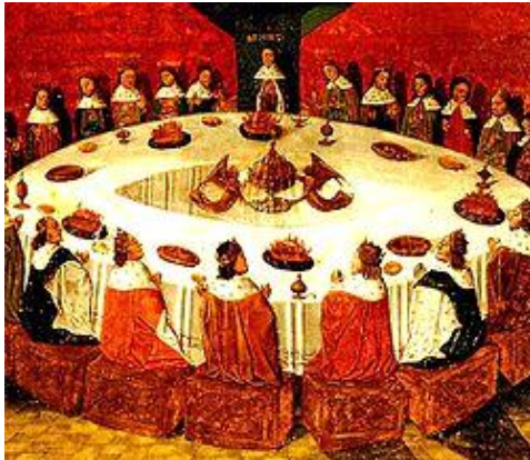
Knights of the Round Table - Chevaliers de la Table ronde ( video )

Μυθικό τραπέζι στο οποίο συγκεντρωνόντουσαν και συνεδρίαζαν οι ιππότες του βασιλιά Αρθούρου . Αυτοί ονομάστηκαν ιππότες της στρογγυλής τραπέζης και τροφοδότησαν συγγραφείς και κινηματογραφιστές. Σήμερα μιλάμε για σύσκεψη στρογγυλής τραπέζης όπου δηλαδή οι συνομιλώντες είναι ισότιμοι.