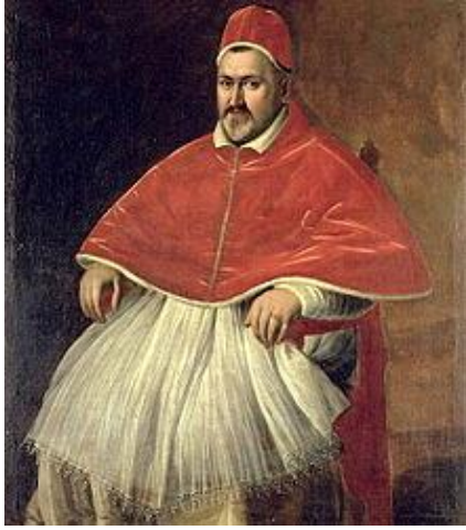
Ο ΙΔΡΥΤΗΣ (Πάπας Παύλος ο 5ος)