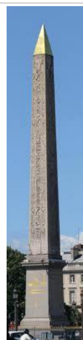
Obélisque - Concorde Paris

Οβελισκος υποκοριστικον του οβελος. Δηλαδη μικρος οβελος . Μαλλον είναι οξύμωρον γιατι αυτοι οι οβελισκοι είναι τεραστιοι.