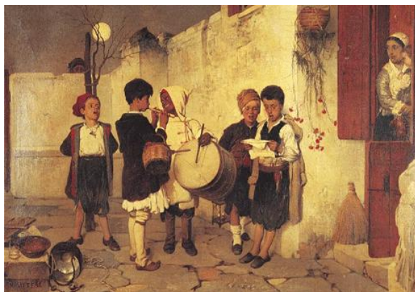
Εικόνα 1 - Νικηφ. Λύτρα (Τα κάλαντα) - 1872

Καλήν εσπέραν άρχοντες, αν είναι ορισμός σας, Χριστού τη Θεία γέννηση, να πω στ' αρχοντικό σας. Χριστός γεννάται σήμερα, εν Βηθλεέμ τη πόλη, οι ουρανοί αγάλλονται, χαίρεται η φύσις όλη.