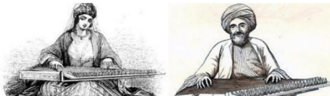
Εικόνα 3 - Ψαλτήριον ή Κανονάκι

Το κανονάκι έλκει πιθανότατα το όνομά του από τον γνωστό μουσικό «Κανόνα» του Πυθαγόρα. Παλιότερα, κυρίως στους μεσαιωνικούς χρόνους, ήταν γνωστό με την ονομασία «ψαλτήριο». Οι αρχές του ψαλτηρίου ανιχνεύονται στον ασιατικό χώρο, πολλούς αιώνες πριν από τους αρχαιοελληνικούς κλασικούς χρόνους. Στην αρχαία Ελλάδα, από πολλούς συγγραφείς έχουμε μαρτυρίες για μουσικά όργανα πιθανόν του τύπου του ψαλτηρίου, με ονομασίες όπως τρίγωνον ψαλτήριον, επιγόνειον, μάγαδις, χωρίς να όμως να υπάρχουν εικονογραφημένες μαρτυρίες. Γι'αυτό μόνο υποθέσεις έχουν γίνει έως σήμερα για τη ακριβή σχέση του αρχαιοελληνικού ψαλτηρίου με το κανονάκι.