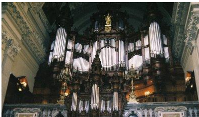
Εικόνα 2 - Εκκλησιαστικό όργανο στην καθεδρική εκκλησιά του Βερολίνου

Το εκκλησιαστικό όργανο έχει τις ρίζες του στο παλαιότερο αρχαιοελληνικό πνευστό όργανο, που έφερε το όνομα ύδραυλις . Μετά τους Έλληνες, το πρωτοπόρο αυτό ακουστικό και τεχνολογικό κατασκεύασμα ταξίδεψε και υιοθετήθηκε πρόθυμα από πολλούς, φτάνοντας μέχρι τους Ρωμαίους και έπειτα τους Βυζαντινούς. Τον 7ο και 8ο αιώνα η ύδραυλις ονομάστηκε πλέον Όργανο και άκμαζε στο Βυζάντιο αλλά και σε όλα τα μεγάλα κέντρα κατασκευής και παραγωγής της όπως η Κωνσταντινούπολη. Αξιομνημόνευτο είναι το περιστατικό της αποστολής ενός εκκλησιαστικού οργάνου ως δώρο το 757 μ.Χ. από τον βυζαντινό αυτοκράτορα Κωνσταντίνο τον Κοπρώνυμο στον αυτοκράτορα των Φράγκων Πεπίνo τον Βραχύ, πατέρα του Καρλομάγνου. Λίγο αργότερα, το 812 μ.Χ., οι βυζαντινοί χάρισαν και ένα δεύτερο στον ίδιο τον Καρλομάγνο. Τον 10ο αιώνα κατασκευάστηκε με έξοδα της εκκλησίας το αγγλικό εκκλησιαστικό όργανο του Γουίντσεστερ, με ασυνήθιστο μέγεθος και με 26 φυσερά που απαιτούσαν 70 άτομα[3], διαθέτοντας επίσης 40 νότες, με 10 αυλούς για κάθε νότα.