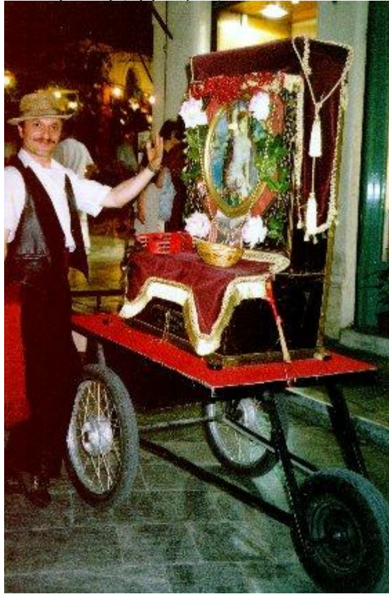
ΕΙΚΟΝΑ 2 – ΡΟΜΒΙΑ Η ΤΡΟΧΗΛΑΤΟΣ

Στη λαϊκή αντίληψη υπάρχει η άποψη ότι η λατέρνα κουβαλιέται στην πλάτη και η ρομβία με ρόδες.