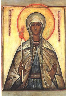
ΕΙΚΟΝΑ 3 ΑΓΙΑ ΓΕΝΟΒΕΦΑ Η ΛΑΜΠΑΔΗΦΟΡΟΣ