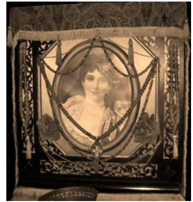
ΕΙΚΟΝΑ 4 ΓΕΝΟΒΕΦΑ Η ΛΑΤΕΡΝΙΚΗ

Μεταφορικός και με σκωπτική διάθεση λέμε «φορτωμένη σαν λατέρνα» (για γυναίκα που φοράει πολλά κοσμήματα και αξεσουάρ).