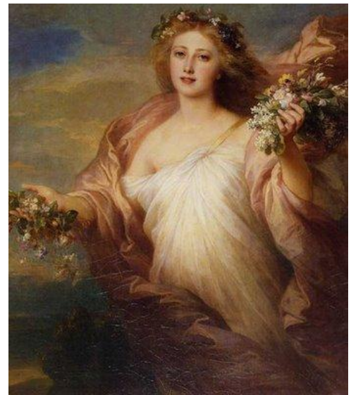
ΕΙΚΟΝΑ 5 - ΑΓΙΑ ΓΕΝΟΒΕΦΑ Η ΑΝΘΟΦΟΡΟΣ

Συνήθως η λατέρνα έφερε εικόνα γυναίκας, τη Γενοβέφα την ηρώίδα του ομώνυμου δράματος (1841) του Γερμανού δραματουργού Φρήντριχ Χέμπελ, υπερμπογιατισμένη και ανθοστόλιστη. Στην Εικόνα 3 η Αγία Γενοβέφα λαμπαδηφόρος και στην Εικόνα 4 η επιλήψιμου διαγωγής Γενοβέφα η λατερνική.