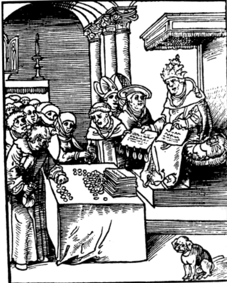
ΕΙΚΟΝΑ 2 : Ο Πάπας εκδίδει συγχωροχάρτια τοις μετρητοίς.

πειρατής την εκποιούσε στο σκλαβοπάζαρο στο Τούνεζι στην Μπαρμπαριά (ανοικτό και τα Σαββατοκύριακα) και το εισπραττόμενο τίμημα υποκαθιστούσε τα λύτρα.