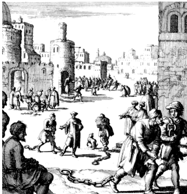
ΕΙΚΟΝΑ 1 : Σκλαβοπάζαρο στο Τούνεζι στην Μπαρμπαριά

Για να λέμε τα σύκα-σύκα αυτή η δέσμευση δεν ήταν αρχικά και τόσο αυτόβουλη. Πειρατές αρπάζανε κάποιον και τον κρατούσαν μέχρι να εισπράξουν τα χρήματα της εξαγοράς του, τα λύτρα.